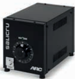
Modelos monofásicos en caja

Modelos ARC con pies y asas / Modelos P2ARC con ruedas y cáncamos.