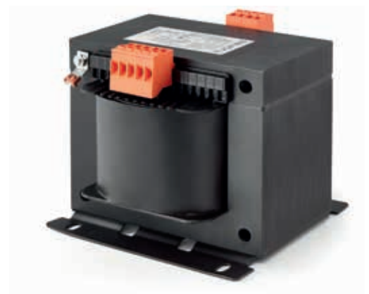
Modelos 'IT M...TC...'