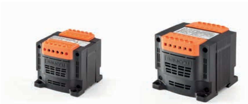
Modelos 'IT M...E...'