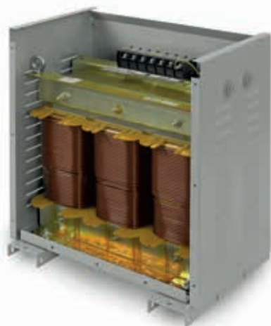
Modelos trifásicos en caja

Para otras potencias, tensiones y/o presentaciones, consultar.