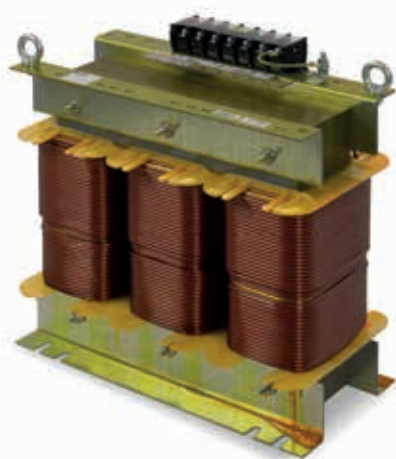
Modelos trifásicos trascuadro

Para otras potencias, tensiones y/o presentaciones, consultar.