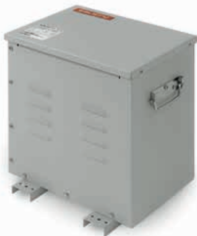
Modelos monofásicos en caja