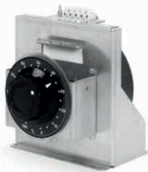
Modelos monofásicos trascuadro

Motor: alimentación a 12 VDC. Consultar para alimentación a 230 VAC.