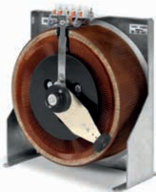
Modelos monofásicos trascuadro

Modelos ARC con pies y asas / Modelos P2ARC con ruedas y cáncamos.