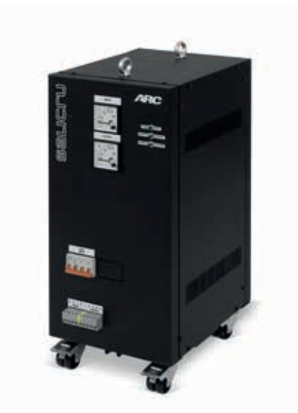
Modelos trifásicos en caja motorizados