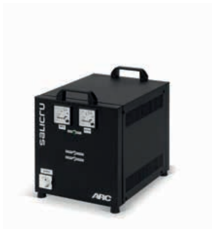
Modelos monofásicos en caja motorizados