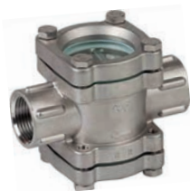
Ref. 2240 Mirillas de turbulencia doble cristal Sight glass, double glass