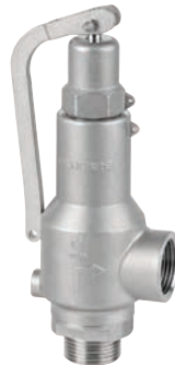
Ref. 2253-2253N Válvula de Seguridad roscada con palanca Stainless steel safety valve with threads and lifting lever