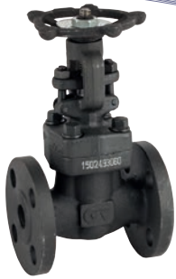
Ref. 2232A Válvula de compuerta con bridas ANSI clase 150 Gate valve with flanged ends ANSI 150 class