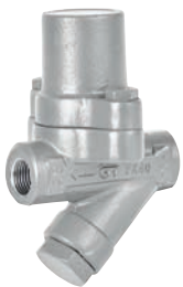
Ref. 2295-2295N Purgador bimetalico con filtro incorporado Bimetalic steam trap with strainer