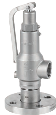
Ref. 2257 Válvula de Seguridad Safety Valve