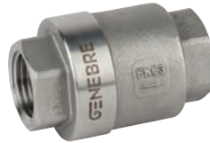
Ref. 2416 Válvula de retención a disco PN 63. Disk check valve PN 63