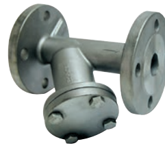
Ref. 2461 Filtro "Y" bridas DIN PN16 AISI 316 Flanged "Y" strainer DIN PN16-AISI 316