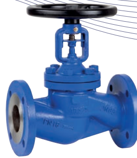
Ref. 2231 Válvula de globo con fuelle. Bridas DIN PN 16 Bellow globe valve. Flanged ends DIN PN 16