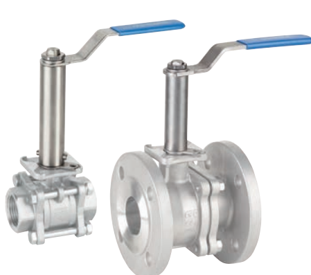
Ref. 5330 Extensor para válvula manual roscada o bridada Extension for threaded or flanged hand valve