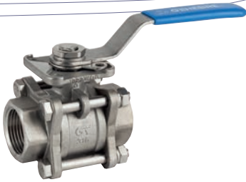
Ref. 2025C Válvula esfera paso total 3 piezas. Juntas y asientos PTFE + 25% grafito 3 pcs full bore ball valve. Ball seats PTFE +25% graphite