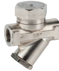
Ref. 2282-2282N Purgador termodinámico con filtro incorporado Thermodynamic steam trap with stra- iner