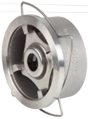
Ref. 2415 Tipo Wafer. Válvula retención disco PN 40 ≤ 100. PN 25 > DN100 Wafer type. Disk check valve PN 40 ≤ 100. PN 25 > DN100