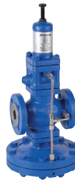
Ref. 2275 Válvula reductora de presión pilotada extremos bridados. Pilot operated pressure reducing valve flanged ends