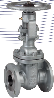
Ref. 2229A Válvula de compuerta con bridas ANSI clase 150 Gate valve with flanged ends ANSI 150 class