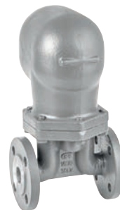
Ref. 2287-2287A Purgador de boya cerrada para vapor (alta capacidad de descarga). Ball float steam trap (high capacity discharge).