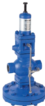
Ref. 2274 Válvula reductora de presión pilotada. Pilot operated pressure reducing Valve.