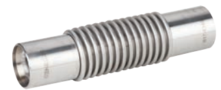
Ref. 2834 Junta de expansión metálica con camisa interior Metal expansion joint with internal liner