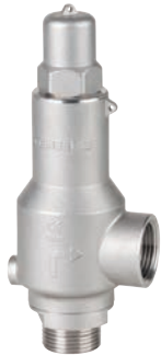
Ref. 2252-2252N Válvula de Seguridad Safety Valve