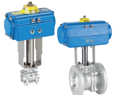
Ref. 5334 Extensor para válvula automatizada roscada o bridada Extension for threaded or flanged automated valve