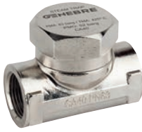
Ref. 2284- 2284N Purgador termodinámico sin filtro Thermodynamic steam trap without strainer