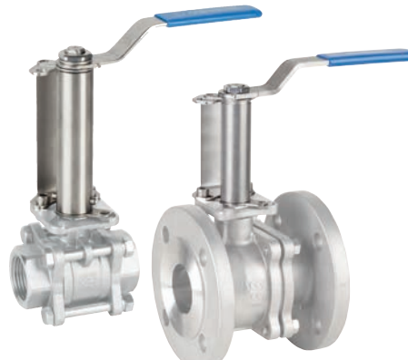
Ref. 5332 Extensor para válvula manual roscada o bridada con sistema de bloqueo Extension for threaded or flanged hand valve with locking system