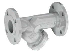
Ref. 2459A Filtro "Y" bridas ANSI B16.42 S-150 Flanged "Y" strainer ANSI B16.42 S-150