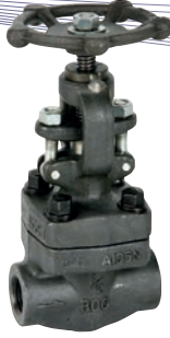
Ref. 2233N-2233S Válvula de globo clase 800 rosca NPT Globe valve class 800 NPT thread ends