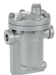
Ref. 2288-2288N Ref. 2289-2289N Purgador de cubeta invertida para vapor. Inverted bucket steam trap.