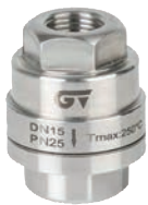
Ref. 2293 Purgador termostático y eliminador de aire Thermostatic steam trap and air vent