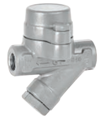
Ref. 2294-2294N Purgador termostático con filtro incorporado Thermostatic steam trap with strainer