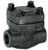
Ref. 2234N-2234S Válvula de retención clase 800 tipo pistón. Rosca NPT Check valve class 800. Piston type. NPT thread ends