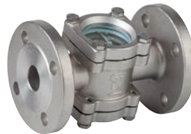
Ref. 2250 Mirillas de turbulencia doble cristal bridas DIN Sight glass, double glass DIN flanges