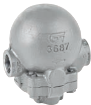
Ref. 2285-2285N Purgador de boya cerrada para vapor Ball float steam trap