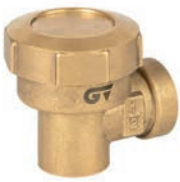
Ref. 2292 Purgador termostático y eliminador de aire Thermostatic steam trap and air vent