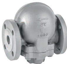
Ref. 2286-2286A Purgador de boya cerrada para vapor Ball float steam trap