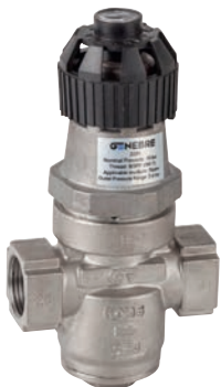
Ref. 2281-2281N Válvula reductora de presión. Pressure reducing valve.