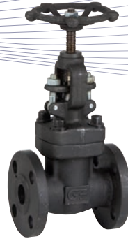
Ref. 2233A Válvula de globo con bridas ANSI clase 150 Globe valve with flanged ends ANSI 150 class