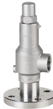
Ref. 2256 Válvula de Seguridad Safety Valve