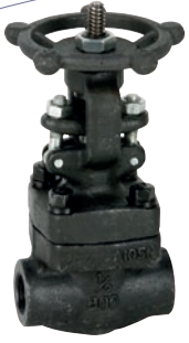
Ref. 2232N-2232S Válvula de compuerta clase 800 rosca NPT Gate valve class 800 NPT thread ends